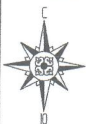
Схема расположения земельного участка или земельных участков на кадастровом плане территории Условный номер земельного участка: :3У1 Площадь участка: 3У1 = 1092 кв.м.